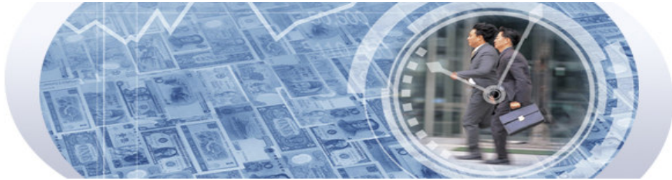
עמוד הבית < חדשות המערכת < ארכיון